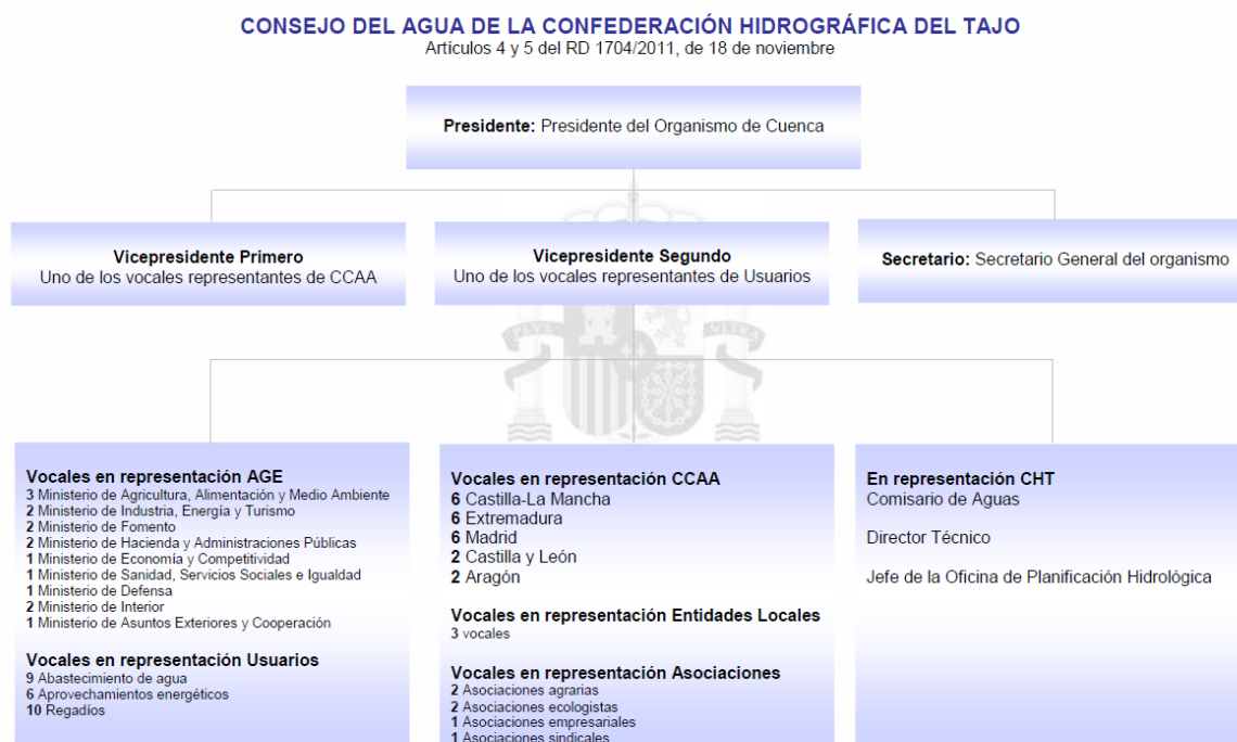
Figura 2. Composición Consejo del Agua de la Confederación Hidrográfica del Tajo

El Consejo del Agua de la Demarcación de la Confederación Hidrográfica del Tajo se rige por el Real Decreto 1704/2011, de 18 de noviembre, por el que se establece su composición, estructura y funcionamiento.