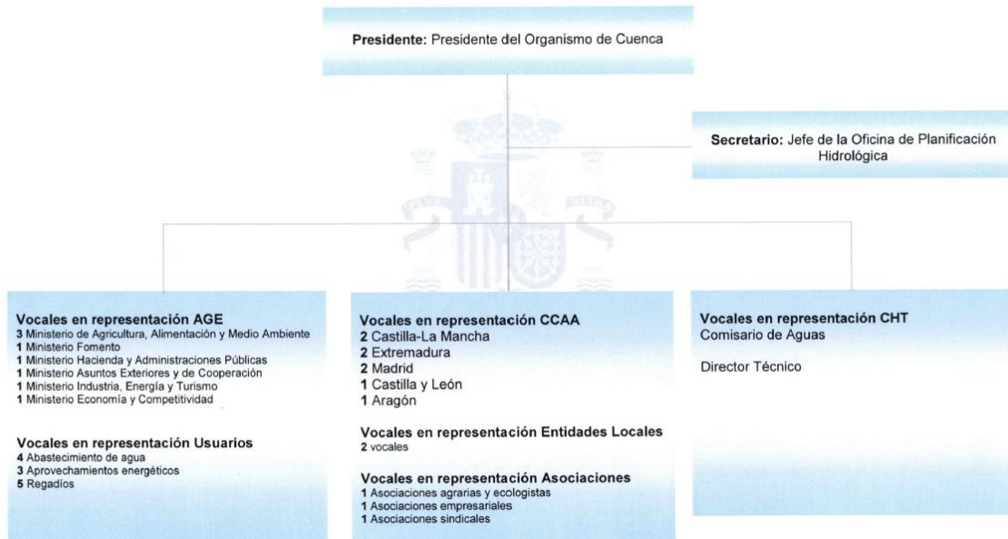
Figura 3. Composición Comisión de Planificación Hidrológica y Participación Ciudadana

Artículo 7 del RD 1704/2011, de 18 de noviembre